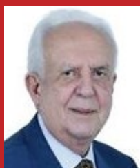
JARBAS VASCONCELOS (PMDB)